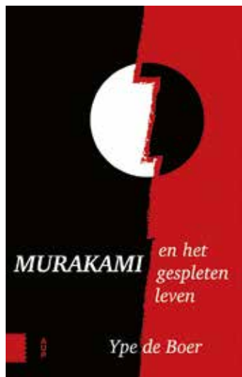
Ype de Boer, Murakami en het gespleten leven , Amsterdam University Press, 2017, 203 pag.